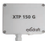
XTP 150G Sensor